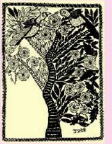
インド・モディラー地方の民族画「スーリヤムッキーの木」