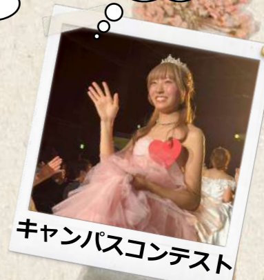
キャンパスコンテスト